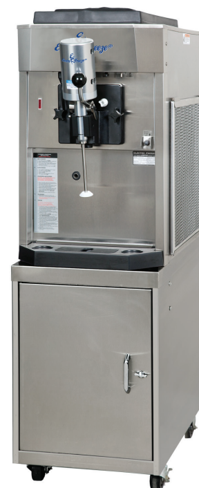
Shown with Optional Mixer and Cabinet