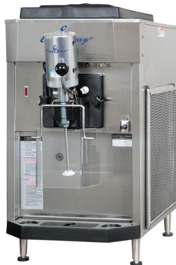
Shown with Optional Mixer and Splash Shield